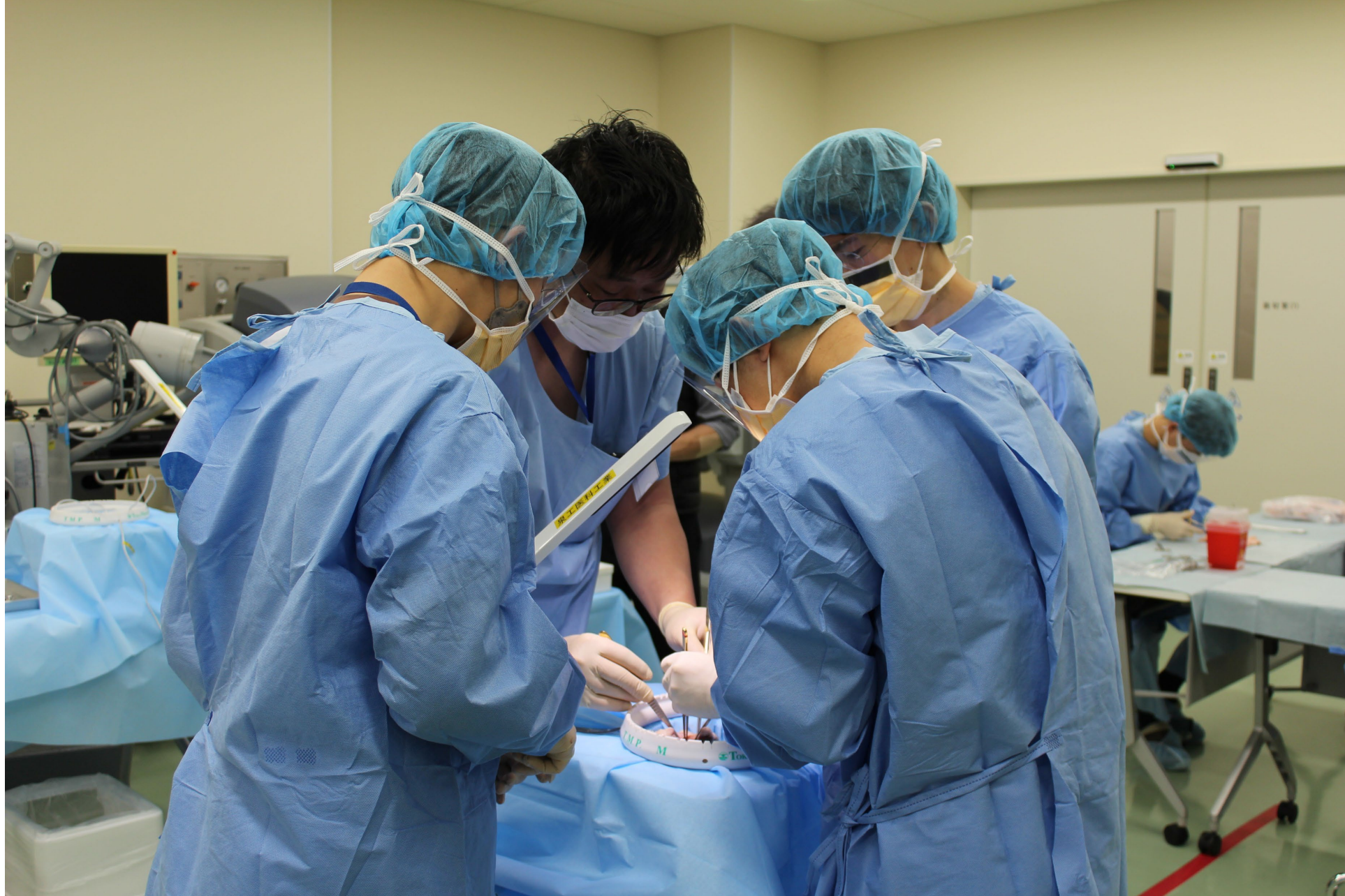
心臓弁置換術ブース