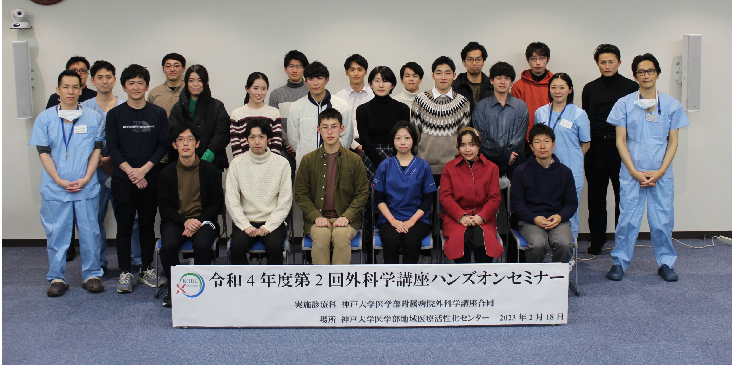
18人の学生・研修医の皆様 (撮影時のみマスクを外しています)