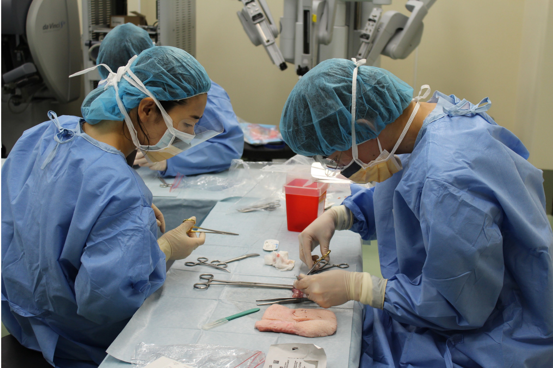
腸管吻合練習ブース