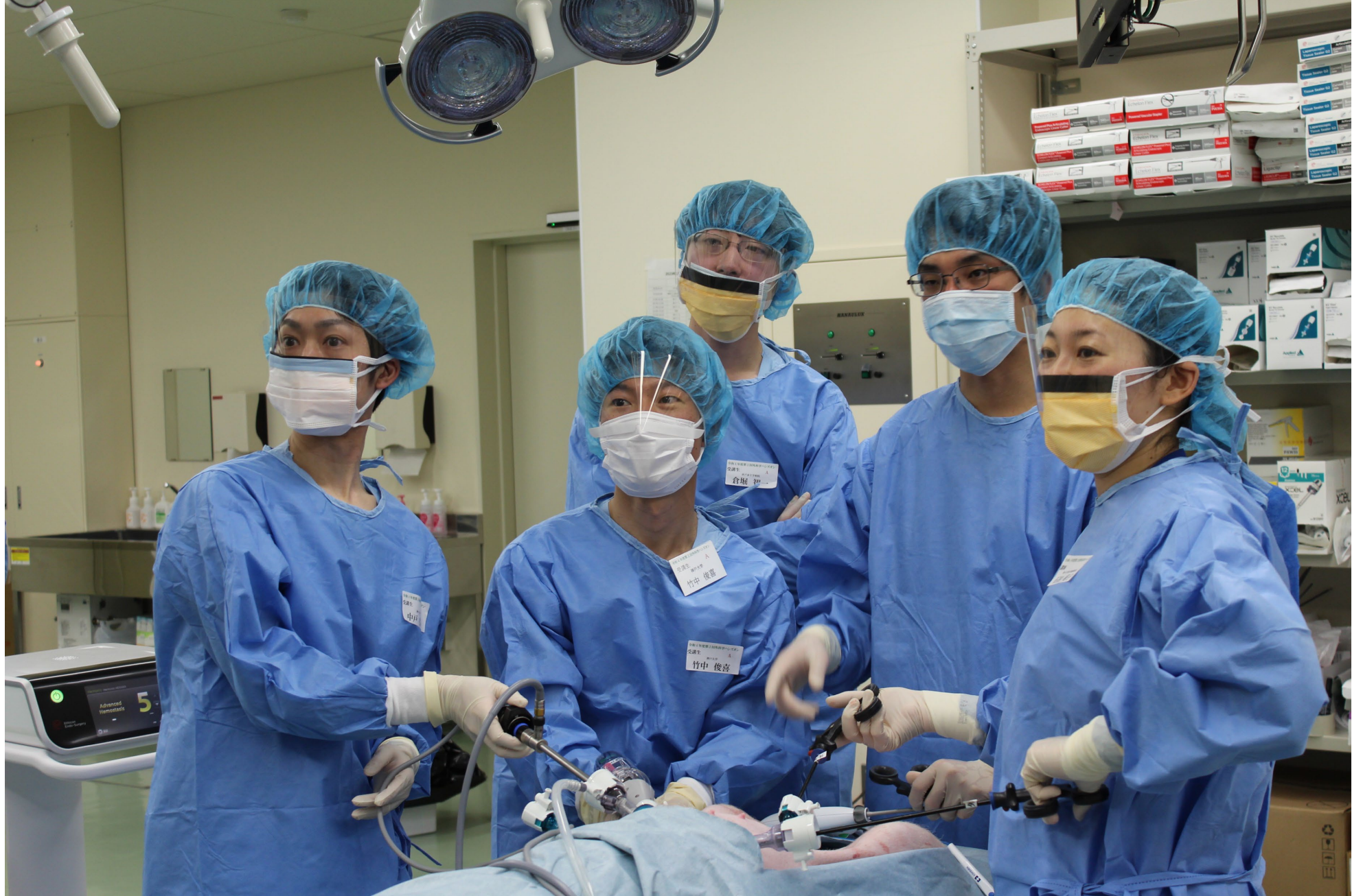
腹腔鏡手術ブース