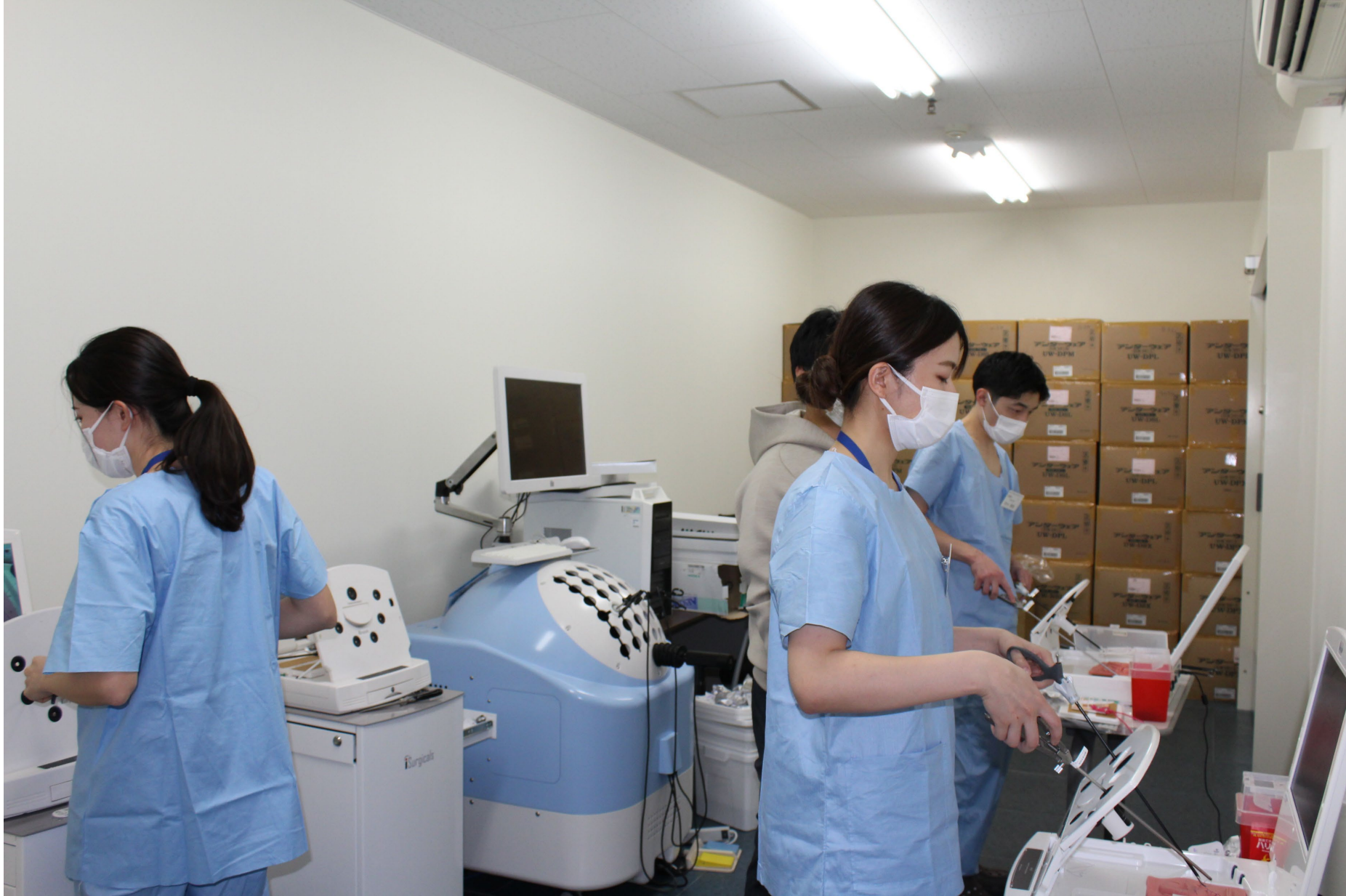
腹腔鏡Dry box縫合練習ブース