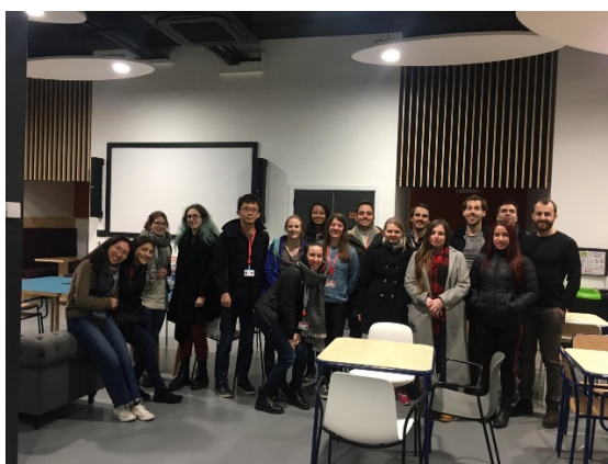
King's College London(KCL)の研究者コミュニティー