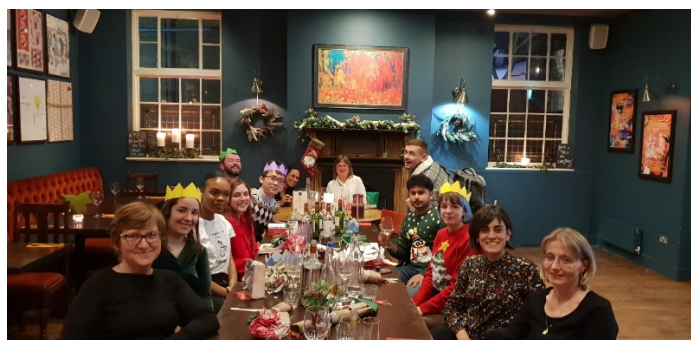
研究先のクリスマスパーティー