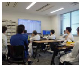
モーニングカンファレンス風景

チーム医療を大切にし、消化管・胆膵とも内視鏡治療に力を入れています。また肝疾患・IBDも積極的に診療しています。消化器外科、腫瘍血液内科、放射線科、緩和ケア内科とのシームレスな連携により、患者に寄り添った医療を提供するよう心掛けています。