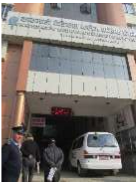
カトマンズ医科大学正面

当カレッジは、スウェーデン、イギリス、インド、パキスタンからの外国人留学生も積極的に受け入れている。外国人留学生は申請すると Wifi、図書館の利用が可。外国人留学生は当大学が所有する学生寮に宿泊が可。