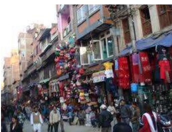
カトマンズの街並み

市内を循環するバス、長距離バスが市内のあちこちから出ているが、大変混雑し、特に通勤通学、帰宅時間前後の朝、夕方は渋滞する可能性があるためあまりお勧めできない。リキシャーは、2人乗りの後部座席がついた自転車。料金は最初に交渉して決めるシステムだが、なるべく一人では利用しないほうが良い。ネパールは日本に比べ、交通量が多く、また路上にも野犬が多い。比較的小となしくはあるが、狂犬病の可能性もあるので近づかないこと。滞在中も自動車、バイクなど容赦なしに追い越し運転をする光景を目にした。交通マナーは決して良いとは言えないため、特に路上を歩行する際は十分注意する必要がある。大学のスタッフから、先進国と比べると歩行者の死亡事故が多いと言われた。