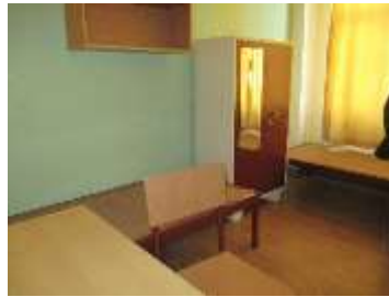
学生寮の部屋の様子